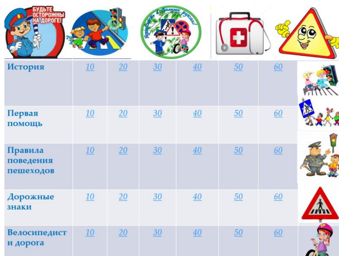
Основной слайд игрового табло

Каждая тема содержит ряд вопросов сложностью от 10 до 60 баллов. При выборе вопроса учащимися, педагог нажимает на «стоимость» вопроса и переходит на слайд с вопросом. Учащиеся дают ответ. Педагог щелчком мыши выводит на экран правильный ответ. Внизу слайда находится значок гиперссылки на основной слайд.